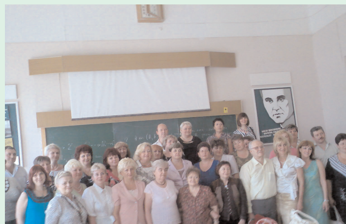
Випускники фізмату 1985 р.