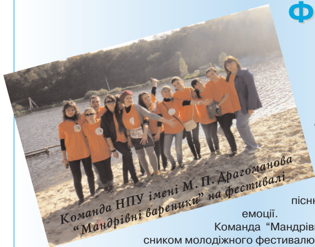
Команда НПУ імені М. П. Драгоманова "Мандрівні вареники" на фестивалі

"...Нас кличе у мандри дорога, Грає чарівна струна, У променях сонця ранкових Ця пісня для тебе луна..."