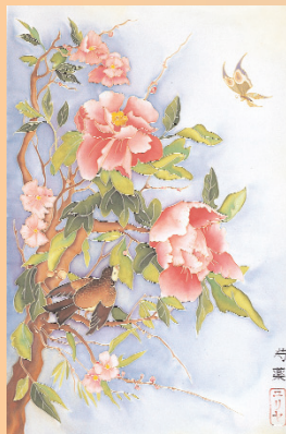
Ю. Жигун. "Квіти"

академії образотворчого мистецтва і архітектури народний художник України Ф. Гуменюк і експерт Міністерства освіти і науки України професор кафедри графічного дизайну Національної академії керівних кадрів культури і мистецтва М. Солом'яний були єдині в своїй думці, що численна сім'я українських педагогів поповнилась молодими талановитими вчителями і викладачами образотворчого мистецтва, за чію майбутню професійну долю можна бути спокійним.